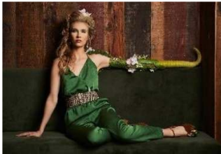
The Alternative Limb Project

Visite guidée avec interprète en langue des signes