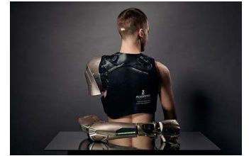
The Alternative Limb Project