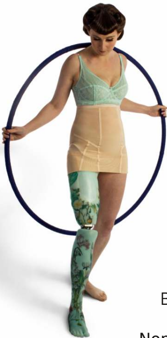
The Alternative Limb Project

Une exposition scientifique, artistique et historique consacrée au handicap.